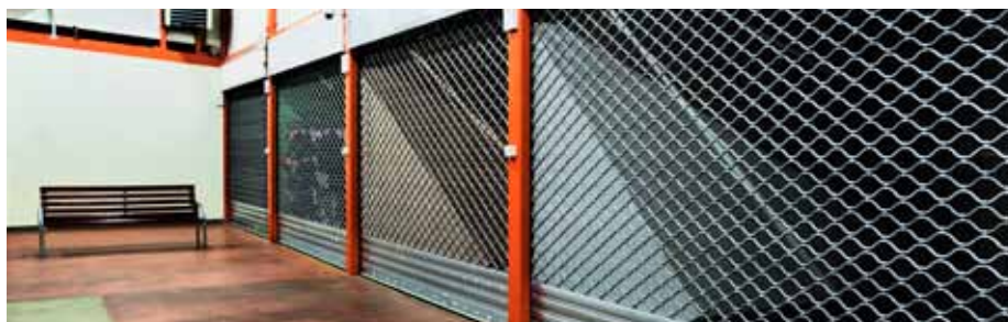
KRATA ROLOWANA SINUSOIDALNA R2 5S